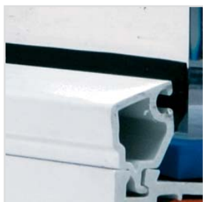
Listwa przyszybowa FORIS