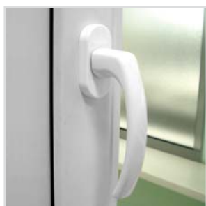
Klamka okienna FORIS

Niezlicowane skrzydło oraz listwa przyszybowa z podcięciem nadają charakterystyczny wygląd okna. Solidna konstrukcja - rama o wysokości 68 mm i głębokości zabudowy 60 mm - gwarantuje wysoką sztywność. Grubość ścianek zewnętrznych wynosząca 3 mm pozwala na tworzenie dużych konstrukcji okiennych. FORIS 100 to dobra izolacja akustyczna i termiczna. Współczynnik izolacji termicznej profili okiennych U_f = 1,6 [W/(m 2 x K)], natomiast współczynnik tłumienia R_w przy zastosowaniu standardowego pakietu szkła wynosi 30 dB. Ze względu na tradycyjne wzornictwo oraz wytrzymałość i niezawodną konstrukcję FORIS 100 jest atrakcyjny dla każdego rodzaju budownictwa.